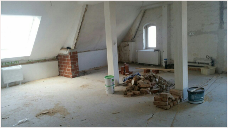
große Küche in Wohnung 5