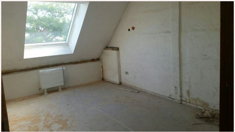
Zimmer mit Dachflächenfenster (gleich in Wohnung 5 & 6)