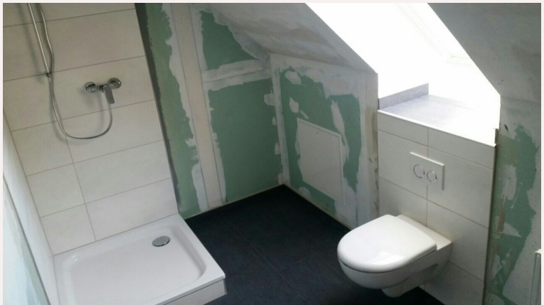
neues Duschbad im Dachgeschoss